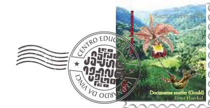
Turma: 4 o ano I,